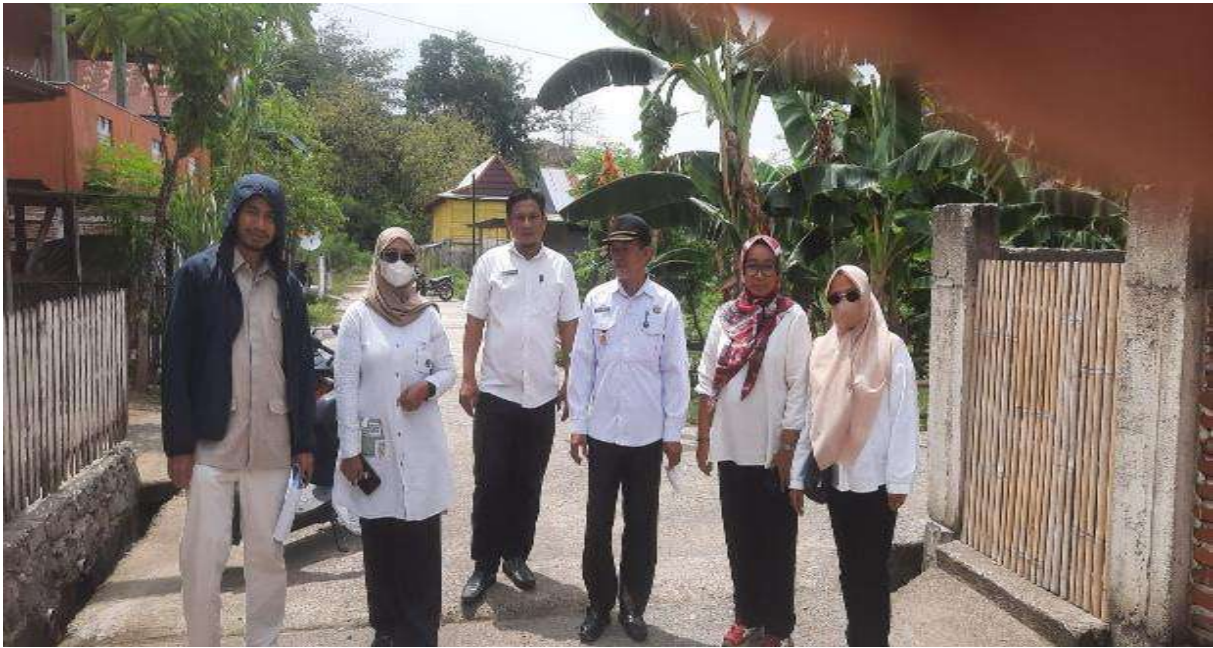
Mendampingi Tim Balai PKP untuk PHO keg.sanitasi kumuh di