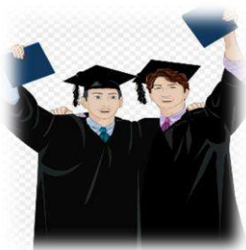
S2: 15 Orang

pendidikan bervariasi dari Sekolah Dasar (SD) sampai Magister Sains (S2).