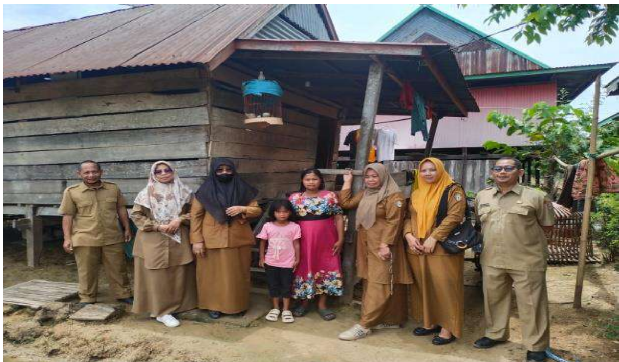
Pendataan Rumah Tidak Layak Huni di Kec.Pitumpanua