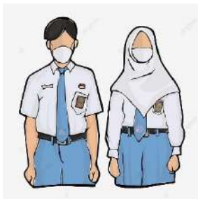
SMA : 15 Orang