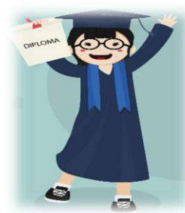
Diploma : -