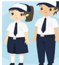
SMP: - Orang