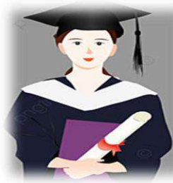
S1: 28 Orang