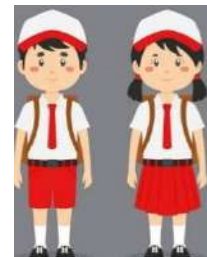
SD: 1 Orang